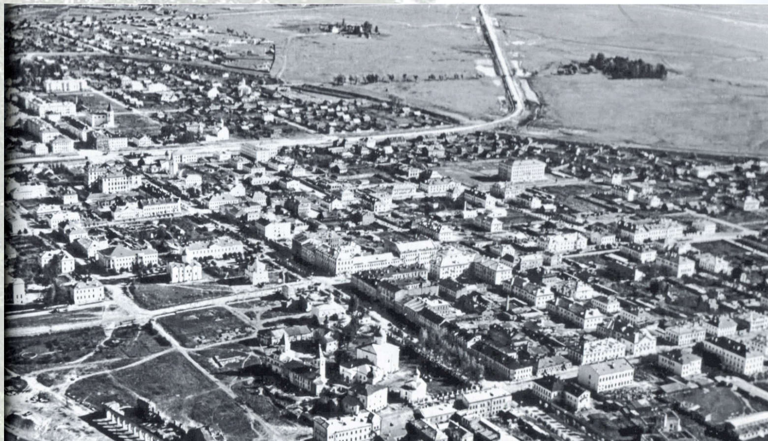
Фото города 1956 года