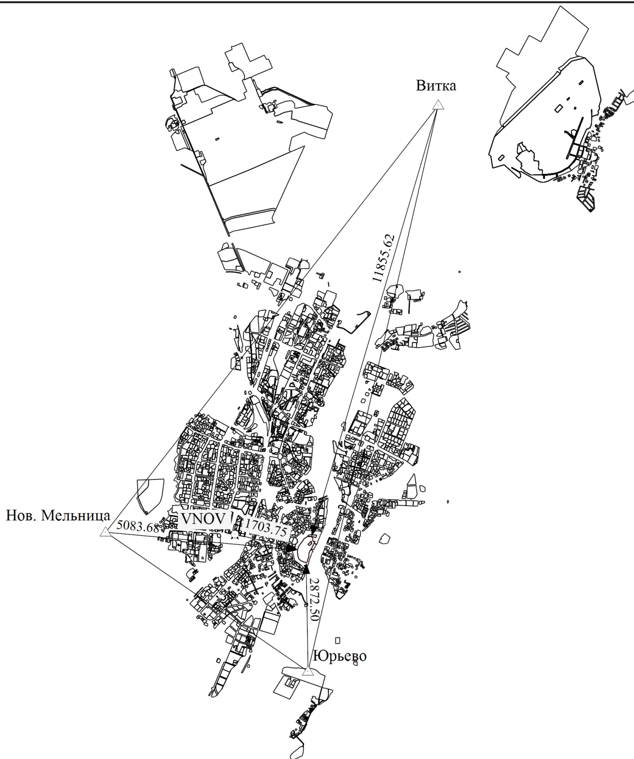
Схема геодезических построений